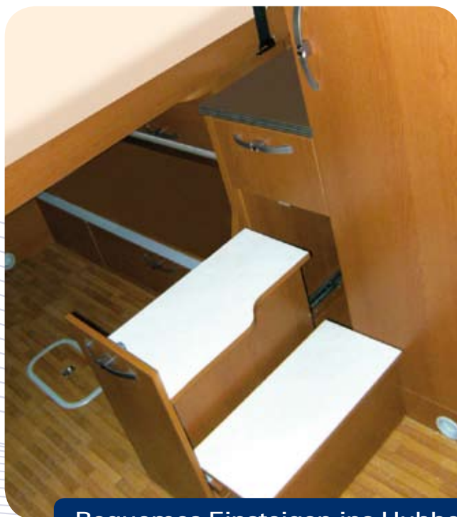
Bequemes Einsteigen ins Hubbett