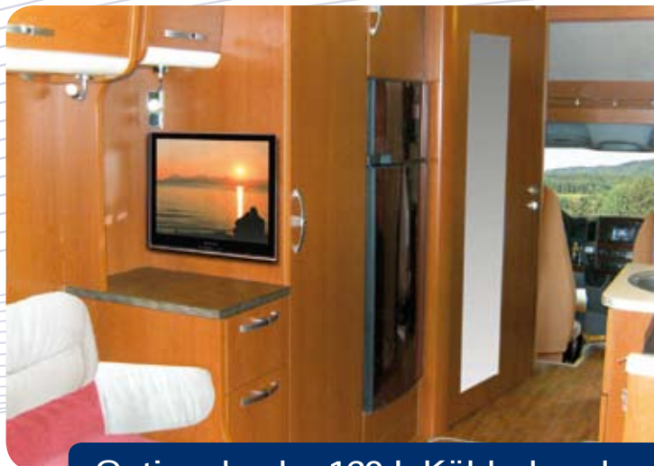
Optional – der 160-L-Kühlschrank